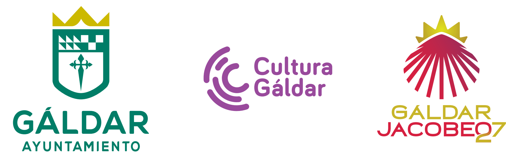
VERSIONES EN VERTICAL, COLOR, BLANCO Y NEGRO Y NEGATIVO

Conjunto de marcas: “Excmo. Ayuntamiento de la Real Ciudad de Gáldar”, “Concejalía de Cultura y Fiestas del Ayuntamiento de Gáldar” y “Año Santo Jacobeo de Gáldar 2027”